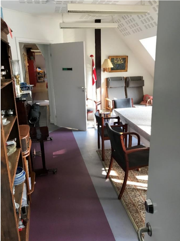
Figur 15: Stor brandbelastning i flugtvejsgang (6.5.1 stk. 3)