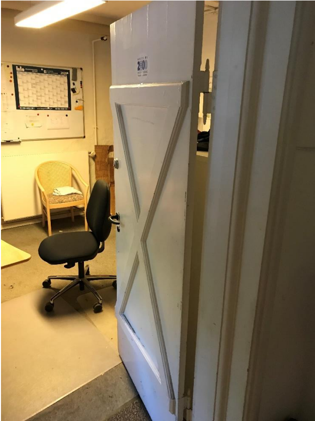
Figur 4: Manglende brandteknisk klassifikation af dør