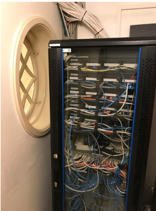
Figur 7: Uklassificeret glas mellem teknikrum/trapperum