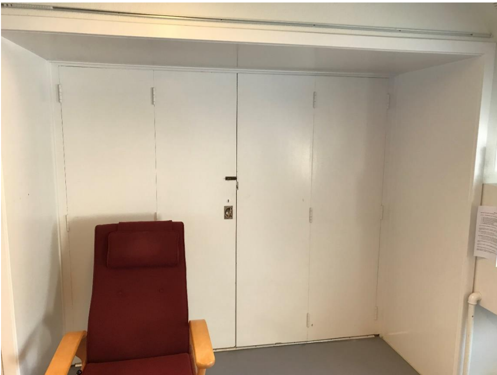
Figur 5: Uklassificeret døre mellem holdsal og opholdsstue