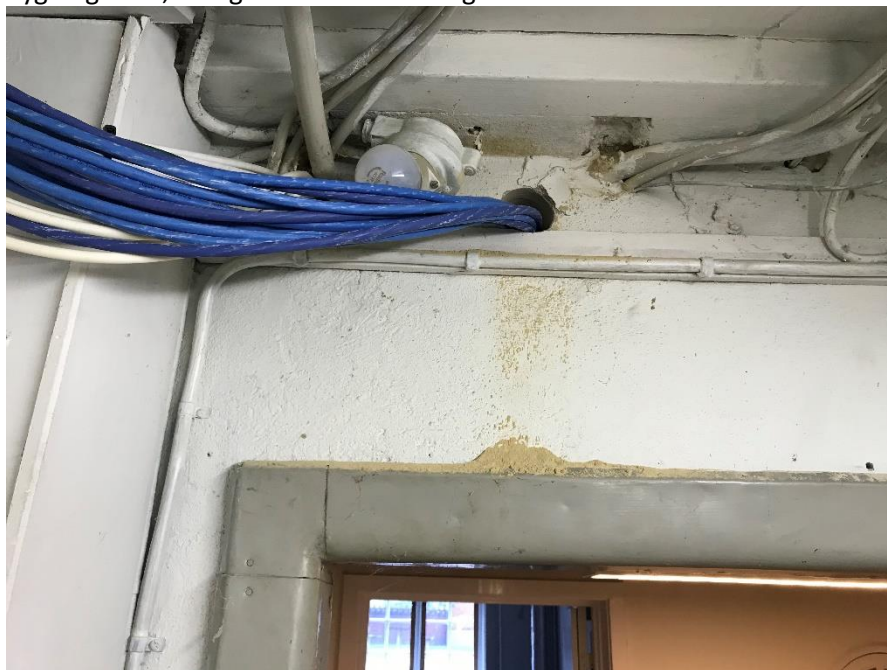
Figur 1: Manglende brandtætning ved installationsgennemføring

Herunder ses aktuelle eksempler på manglende brandtætning omkring gennemføringer i brandadskillende bygningsdele, manglende brandmæssig adskillelse mellem lokaler i det aktuelle byggeri.