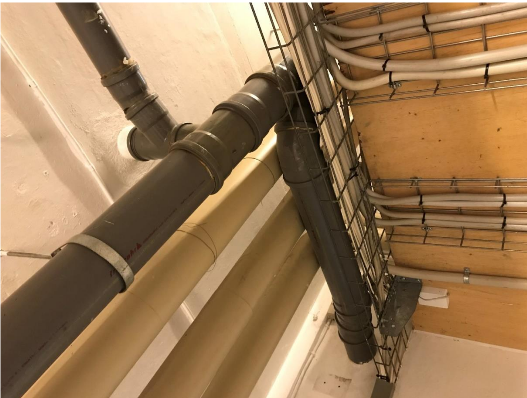
Figur 3: Manglende brandsikring og brandtætning ved faldstammer/afløb.