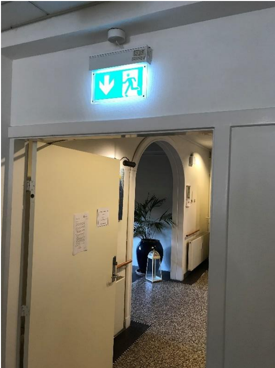
Figur 8: Udfyldninger rundt om døre opfylder formodentlig ikke krav til den krævede brandmodstandsevne