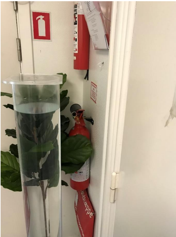
Figur 16: Håndildsluknings udstyr er ikke frit tilgængeligt