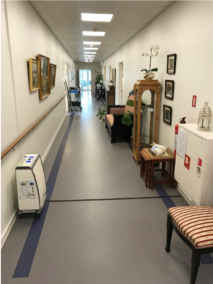
Figur 10: Manglende opdeling af flugtvejsgang pr. 25 m med en røgtæt dør (6.11.2 stk. 2) samt manglende friholdelse af den nødvendige fribredde af flugtvejsgang på 2.4 m jf. 6.11.4 stk. 2. Samtidig er brandbelastning i flugtvejsgange større end foreskrevet. (6.5.1 stk. 3)