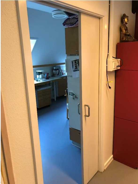
Figur 11: Døre der anvendes som flugtvej, skal udføres som sidehængt dør (6.5.4 stk. 4)