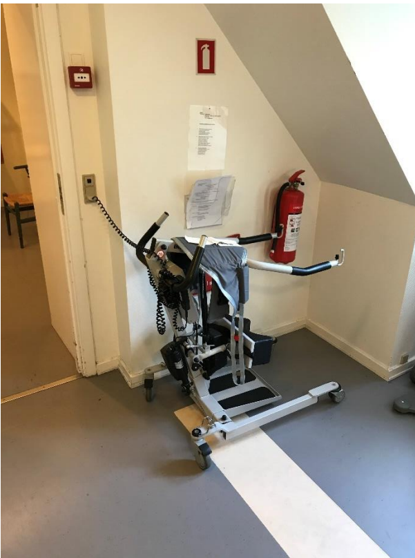
Figur 12: Opladning af elektriske hjælpemidler i flugtvejsgang (6.5.1 stk. 3)