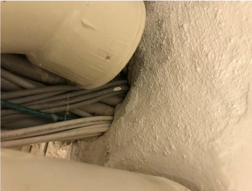
Figur 2: Manglende brandtætning ved installationsgennemføring