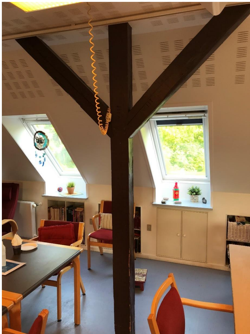
Figur 9: Ubeskyttet trækonstruktion. Kravet til brandmodstandsevnen er 30 minutter i henhold til BR82. Dette krav er dog øget til 60 minutter i BR18.

Stk. 7: Bærende konstruktioner i bygningens øverste etage skal udføres mindst som BD-bygningsdel 30.”