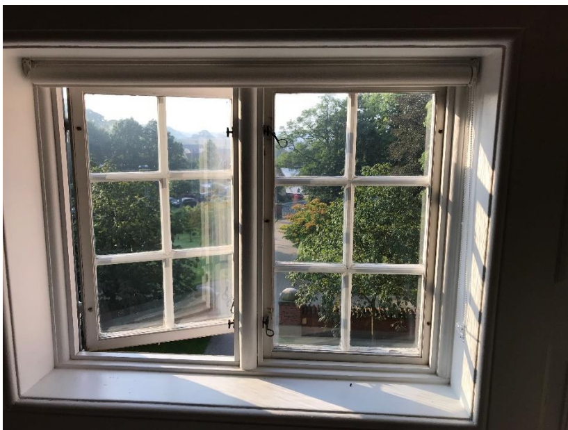
Figur 13: Vinduer i træningssal opfylder ikke krav til redningsåbninger (6.6.1 stk. 4)