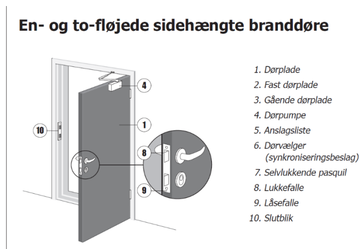
Illustration fra DBI vejledning 26 – Branddøre og brandskydeporte, 1. udgave, juni 1990.

DBI vejledning 26 – Branddøre og brandskydeporte. Branddøre skal udføres med låsekasse med lukkefalle og låsefalle. Se illustrationen herunder.