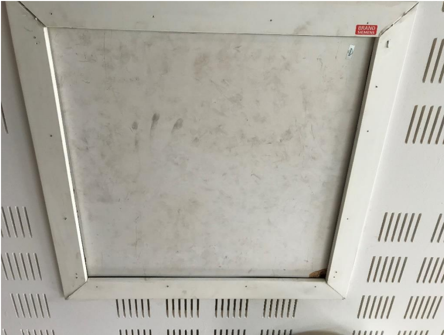
Figur 6: Manglende brandteknisk klassifikation af loftlem